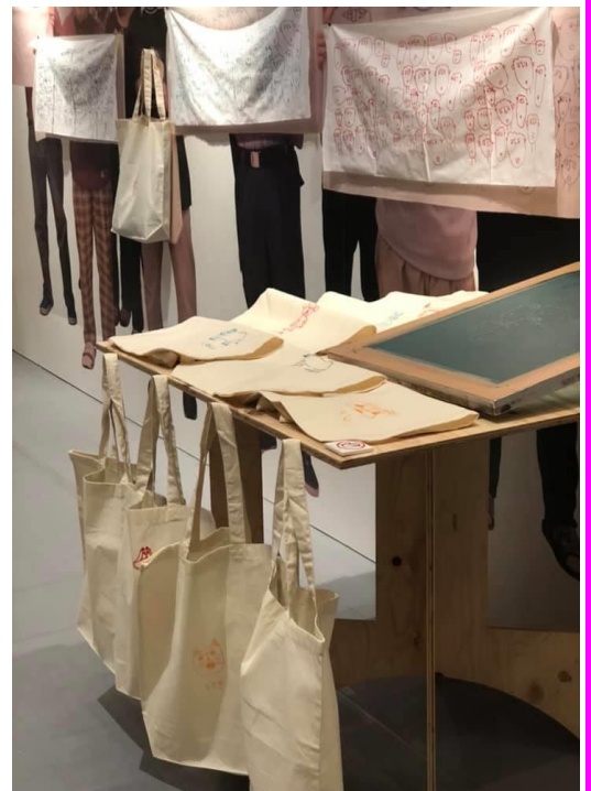
写真上：みずほ園の皆さん

補助金を申請するためには、準備が大変でした。申請するにあたって、必要書類の作成方法など分からないことばかりでしたが、市民協働センターの皆さんに相談やアドバイスをしてもらい、補助金を活用し、活動することができました。地域づくりの活動をするための補助金について気軽に相談できることを多くの人に知ってほしいです！